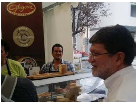
S PREDSTAVNICIMA „SLOWFOOD INTERNACIONALA“ U POSJETU SVEUČILIŠTU GASTRONOMSKIH ZNANOSTI I NAJVEĆEM EUROPSKOM SAJMU SIRA, POLLENZO, 19.9.2015.