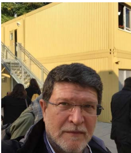
RADNI POSJET CENTRIMA ZA PRIHVAT I INTEGRACIJU IZBJEGLICA, HAMBURG, 20.10. 2015.