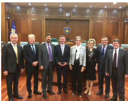
S KOLEGAMA IZ AFET-A U SLUŽBENOJ MISIJI NA KOSOVU, 25.9.2015.