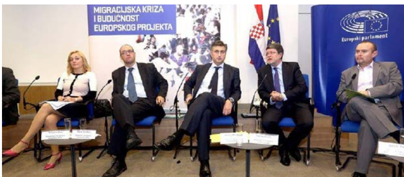
JAVNA RASPRAVA „MIGRACIJSKA KRIZA I BUDUĆNOST EUROPSKOG PROJEKTA“, KUĆA EUROPE, 9.10.2015.

„Izbjeglička kriza je okidač koji je otvorio raspravu o tome kakva bi Europska unija trebala biti sutra ili za desetak godina“