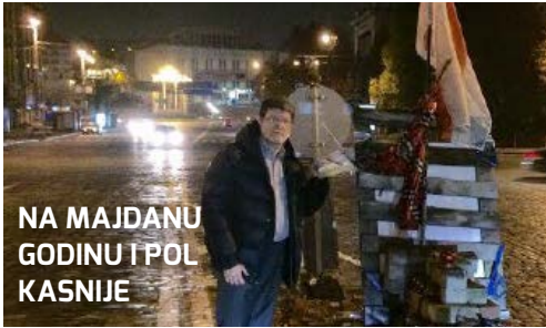
NA MAJDANU GODINU I POL KASNIJE