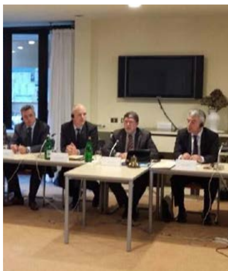
KONFERENCIJA „REFORMSKA AGENDA EU ZA BIH“, CADENABBIA, ITALIJA, 18.11.2015.