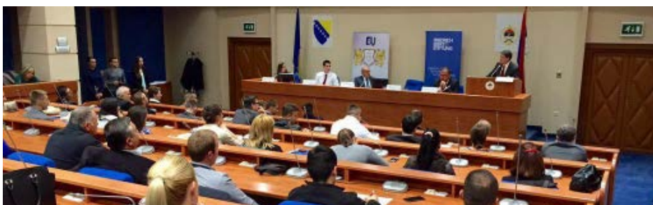
“POLITIČKI CAFFE“, BANJA LUKA – RASPRAVA O IZAZOVIMA I EUROPSKOM PUTU BIH, 2.10.2015.

„Izbjeglička kriza je okidač koji je otvorio raspravu o tome kakva bi Europska unija trebala biti sutra ili za desetak godina“