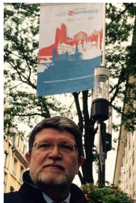
NA PLENARNOJ SJEDNICI MEĐUPARLAMENTARNE KONFERENCIJE O ZAJEDNIČKOJ VANJSKOJ I SIGURNOSNOJ POLITICI I ZAJEDNIČKOJ SIGURNOSNOJ I OBRAMBENOJ POLITICI, LUXEMBOURG, 5.9.2015.