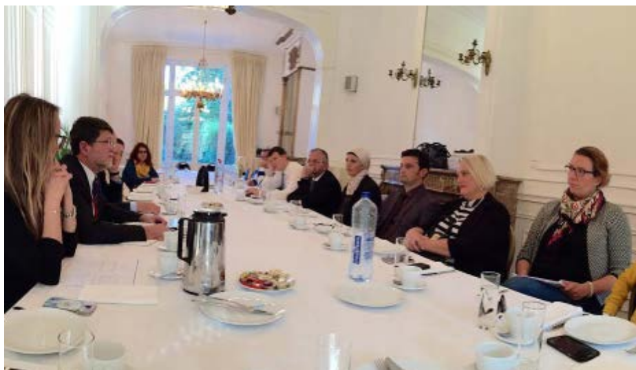
SUSRET S IZASLANSTVOM NOVOIZABRANIH ZASTUPNIKA U PARLAMENTARNOJ SKUPŠTINI BIH, BRUXELLES, 12.10.2015.