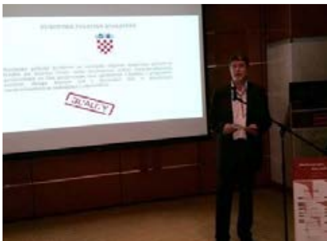
MEĐUNARODNI DAN ZADRUGA, ZAGREB, 1.7.2016.

„U dvije i pol godine članstva u EU napravili smo značajan posao na zaštiti autohtonih domaćih proizvoda. Put novim udrugama proizvođača je otvoren.“