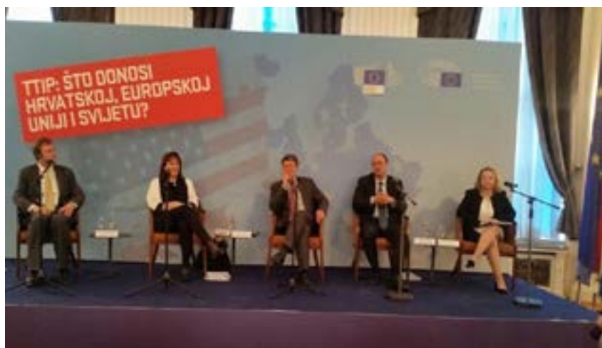
KONFERENCIJA O TTIP-U, ZAGREB, 26.5.

„Vizni reciprocitet je pravilo EU; slobodnoj trgovini treba prethoditi slobodno kretanje građana.“